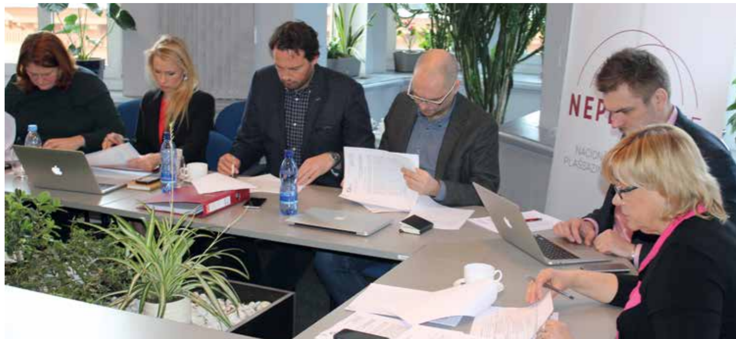
Pirmā jaunās NEPLP sēde, 2017. gada 6. februāris.