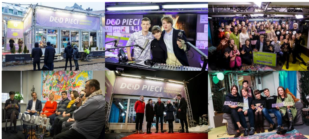
„Dod Pieci!” Stikla studija, diskusija Ziedot.lv par veselīgas piesaistes veidošanu ar bērnu, „Dod Pieci!” dīdžeji ar komandu.

Savukārt gada izskaņā jau piekto gadu Latvijas Radio sadarbībā ar Latvijas Televīziju, sabiedrisko mediju portālu lsm.lv un Ziedot.lv organizēja labdarības maratonu „Dod Pieci 2018” , kas bija veltīts jautājumiem par laimīgu bērnu audzināšanas priekšnoteikumiem mūsdienu sabiedrībā. 2018. gada ziedojuma mērķis bija mācību programmas izveide un mācību nodrošināšana jauniešiem visā Latvijā, lai gūtu psiholoģisku un praktisku atbalstu par emocionālās inteliģences attīstību un veselīgas piesaistes veidošanu ar bērnu. Maratons notika no 17.-23. decembrim Stikla studijā Doma laukumā, ziedojumos savācot vairāk nekā 122 tūkstošus eiro mērķa atbalstam.