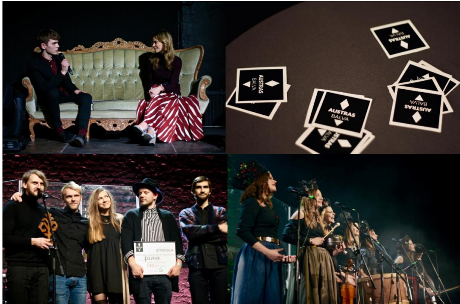
Austras balvas 2018 pasniegšanas ceremonija.

Savukārt gada izskaņā jau piekto gadu Latvijas Radio sadarbībā ar Latvijas Televīziju, sabiedrisko mediju portālu lsm.lv un Ziedot.lv organizēja labdarības maratonu „Dod Pieci 2018” , kas bija veltīts jautājumiem par laimīgu bērnu audzināšanas priekšnoteikumiem mūsdienu sabiedrībā. 2018. gada ziedojuma mērķis bija mācību programmas izveide un mācību nodrošināšana jauniešiem visā Latvijā, lai gūtu psiholoģisku un praktisku atbalstu par emocionālās inteliģences attīstību un veselīgas piesaistes veidošanu ar bērnu. Maratons notika no 17.-23. decembrim Stikla studijā Doma laukumā, ziedojumos savācot vairāk nekā 122 tūkstošus eiro mērķa atbalstam.