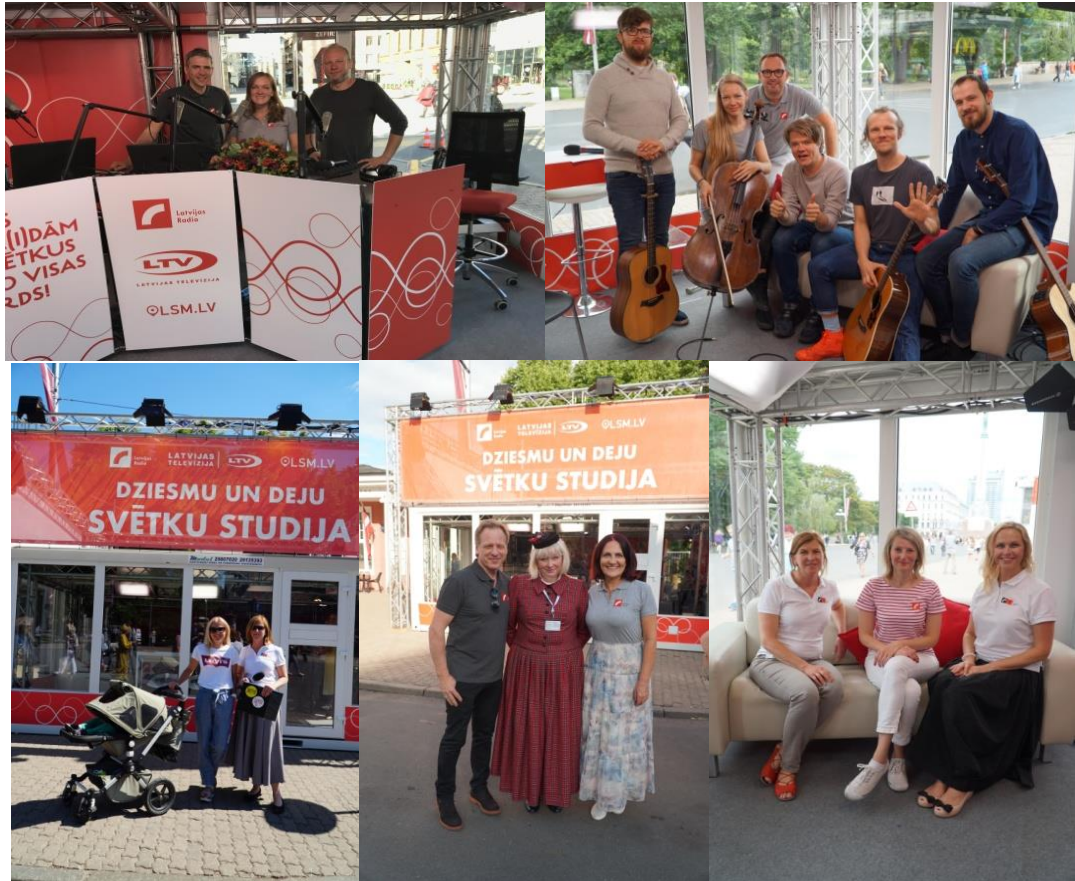
Latvijas Radio Dziesmu un Deju svētku studija pie Brīvības pieminekļa.

Tuvojoties Latvijas valsts 100. gadadienai, Latvijas Radi 1 novembrī noslēdza raidījuma ciklu - Latvijas simtgadei veltītu spēli „Faktu mednieki”. Spēles mērķis bija noskaidrot, kurā Latvijas novadā – Kurzemē, Zemgalē, Vidzemē vai Latgalē – ir zinošākie jaunieši vidusskolas vecuma grupā par Latvijas vēsturi, kultūru, dabu, zinātni, ģeogrāfiju un sportu. Raidījuma finālspēle un apbalvošanas ceremonija tika organizēta Latvijas Nacionālajā teātrī - vietā, kur 1918. gada 18. novembrī dibināta Latvijas Republika.