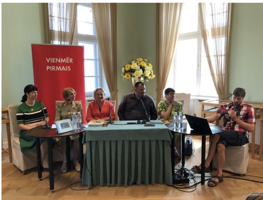
„Krustpunktā” tiešraide no Latvijas Lauksaimniecības universitātes.

LR1 informatīvi analītiskais raidījums „ Krustpunktā ” 2018. gadā turpināja reģionālo tiešraižu ciklu, lai veidotu plašākas diskusijas par tiem jautājumiem, kas aktuāli Latvijas novados. Februāra beigās “Krustpunktā” skanēja no Valkas Vidzemē, lai pierobežā salīdzinātu latviešu un igauņu konkurences un sadarbības aspektus. Kurzemē Kuldīgas galvenajā bibliotēkā tika meklētas atbildes tematam – vai un kad mēs brauksim pa labākiem ceļiem. Latgalē diskusija notika Upītes tautas namā, tuvplānā pētot – ko ciemam nozīmē palikt bez savas skolas. Savukārt maija beigās “Krustpunktā” komanda devās uz Zemgali, lai Jelgavā diskutētu par lauksaimniecības jautājumiem: vai Latvijas zemniekam ir viegli konkurēt Eiropas tirgū, un kādi ir bijuši zemnieku ieguvumi un zaudējumi 14 gados kopš Latvijas iestāšanās Eiropas Savienībā.