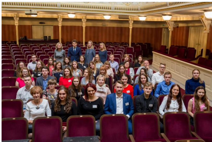
Radījuma „Faktu mednieki” dalībnieki un radošā komanda, noslēguma raidījumā ierakstā Latvijas Nacionālajā teātrī.

Tuvojoties Latvijas valsts 100. gadadienai, Latvijas Radi 1 novembrī noslēdza raidījuma ciklu - Latvijas simtgadei veltītu spēli „Faktu mednieki”. Spēles mērķis bija noskaidrot, kurā Latvijas novadā – Kurzemē, Zemgalē, Vidzemē vai Latgalē – ir zinošākie jaunieši vidusskolas vecuma grupā par Latvijas vēsturi, kultūru, dabu, zinātni, ģeogrāfiju un sportu. Raidījuma finālspēle un apbalvošanas ceremonija tika organizēta Latvijas Nacionālajā teātrī - vietā, kur 1918. gada 18. novembrī dibināta Latvijas Republika.