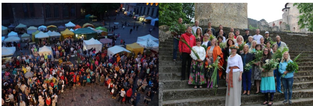
“Gadsimta garākā Līgodziesma” noslēguma zibakcija Doma laukumā un Cēsu Pils kora priekšnesums projekta laikā.

Gadsimta garākās Līgodziesmas mērķis ir atspoguļot līgošanas unikālo tradīciju, vienlaikus stiprinot tautas pašapziņu, piederības izjūtu un saliedētību. Sadarbībā ar sabiedrisko mediju portālu ism.lv , līgodziesmas ceļam bija iespējams sekot līdzi ne vien LR2 ēterā, bet arī internetā – portālā un LR2 sociālo tīklu kontos.